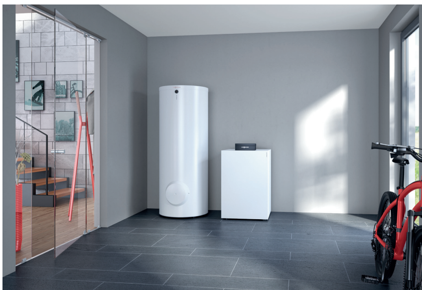
Pompe à chaleur Vitocal 200-G avec ballon d'eau chaude sanitaire Vitocell 100-W (à gauche)

La pompe à chaleur Vitocal 200-G eau glycolée / eau, grâce à son fonctionnement silencieux, peut trouver facilement place à proximité des espaces de vie